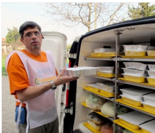
Volontario del banco alimentare

Publicato alle 8:07 am del 12 gennaio, 2015 da Giuseppe Lavopa & nella categoria News .